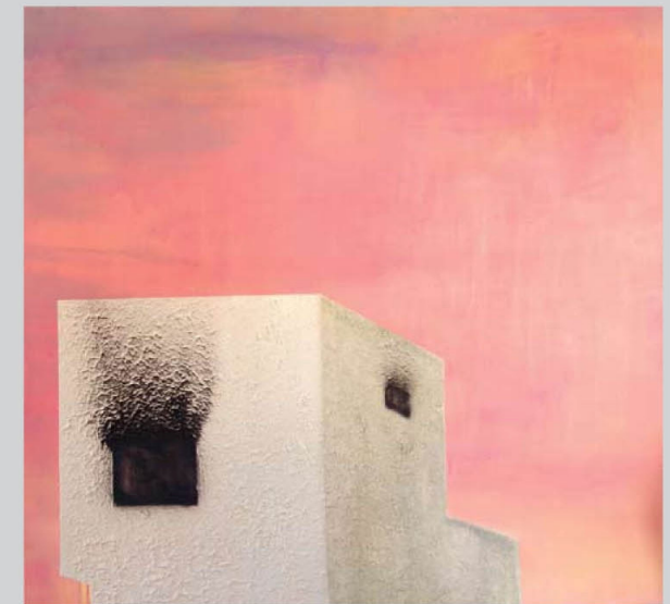
רוני שניאור, 2007, אקריליק ושמן על בד, 150x145 ס"מ

קרְטוּגְרָפִיָה, כְּרְטוּגְרָפִיָה (י' khartes = מסה + graphein = לכתוב), מְפָאֵת; מדע המיפוי והמסות; תורת שירטוט מסות גיאוגרפיות והקריאה בהן; הק' משתדלת לאסוף נתונים ומידות על התוואים השונים של כדור-הארץ, לנתחם ולמסרם בצורה רישומית-פלסטית*, בקנה-מידה מוקטן, המבליט בכירור את צורתם.