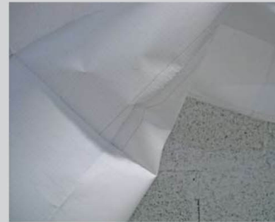
יעל רוכמן, פרט, ללא כותרת

שיח גלריה עם האמניות יתקיים ביום שבת 18.4.09 בשעה 13:00