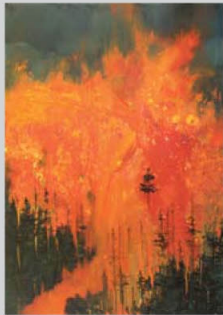
רוני שניאור, 2007, אקריליק ושמן על בד, 180x130 ס"מ

יעל רוכמן • נולדה ב-1978 בירושלים • 2002-2006, למדה אמנות פלסטית באקדמיה לאמנות ועיצוב, בצלאל, ירושלים • מלגת הצטיינות מטעם בנק לאומי • תערוכות • יולי 2006, תערוכת בוגרים בטרמינל 1 במסגרת חגיגות המאה של בצלאל • מרץ 2007, "בכורות", תערוכה קבוצתית בגלריה מנשר, תל אביב • מרץ 2007, "מרור", תערוכה קבוצתית בגלריה אלפרד, פלורנטין • אוקטובר 2007, "תחתיות", תערוכה קבוצתית במעבדה, ירושלים • ספטמבר 2008, תערוכה קבוצתית בכורש 14, ירושלים, במסגרת "מנופים", פתיחת עונת הגלריות בירושלים • אוקטובר 2008, "בשורות ראשונות", תערוכה קבוצתית בבית האמנות, מבשרת ציון • נובמבר 2008, "מבצע כורש", תערוכה קבוצתית בכורש 14, ירושלים