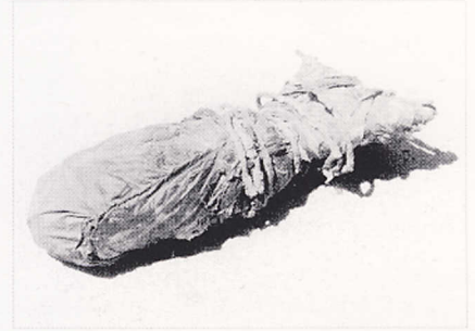
"חפץ" טכניקה מעורבת, ניילון, חוטי ברזל, זפת 5 X 13 X 22 ס"מ