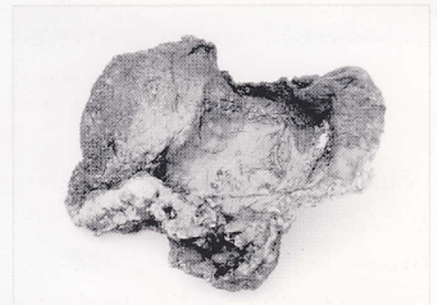
"קערה שרופה" פלסטיק חרוך, חוט ברזל, חומרי אדמה, זפת 15 X 25 X 30 ס"מ