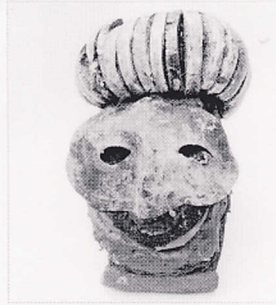
"ראש" פלסטיק, ספוג, זפת, עץ 10 X 15 X 24 ס"מ