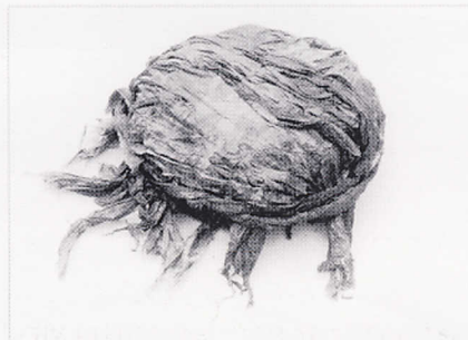
"חפץ עטוף" טכניקה מעורבת, ניילון, זפת 7 X 20 X 20 ס"מ