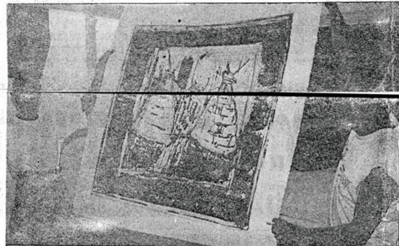
עבודת תחריט. לעשירים בלבד

פרקי זמן שהסרנה היתה תחת מתח גבוה. אינטנסיביות, הרמות קול. היתה תחושה משותפת לשני הצדדים שהדברים צריכים להיות במיטבם. היתה זו הודמנות להתעמת בגישה אמנותית, שיפוטית, היות והאיש ביקורתי מאוד כלפי מה שנעשה באמנות הישראלית. הוא אהב את כברי וציין שהיתה זו העבודה המשמעותית ביותר שלו השנה. נכון שהוא בא לכאן עם אינטרס אישי וגם ייבא לכאן את ירושלים הנצחית שלו. חשתי שחשוב לו מואד שהסרנה תהפוך למכניסה.